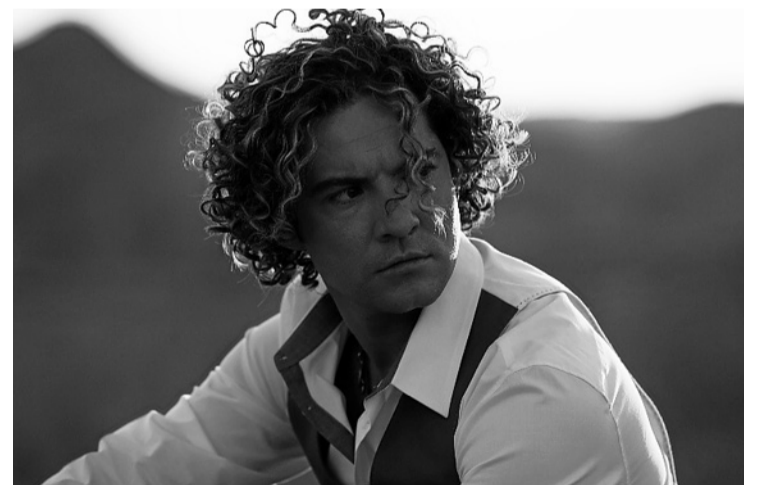
■ El cantante David Bisbal, en tres de las imágenes tomadas en Almería para su nuevo disco, 'Sin mirar atrás'.