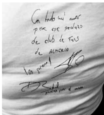
■ Dedicatorias de ida y vuelta en camisetas.