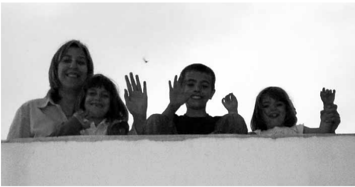
■ Adiós a las nubes, decían estos chicos desde la plaza. / JAI