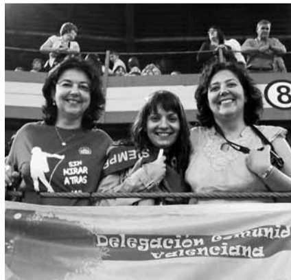
■ Las hermanas Leyva y Mamen.