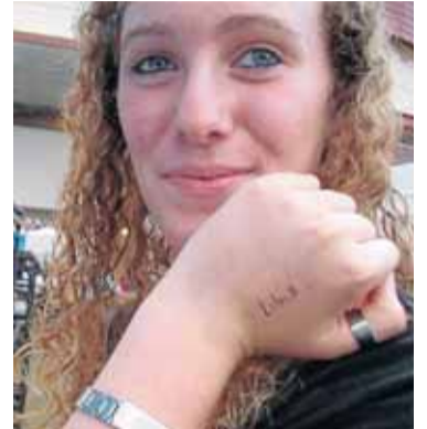
■ Libia apuntó su nombre.