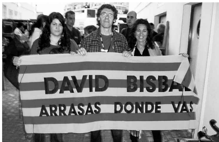
■ De Barcelona y Almería.