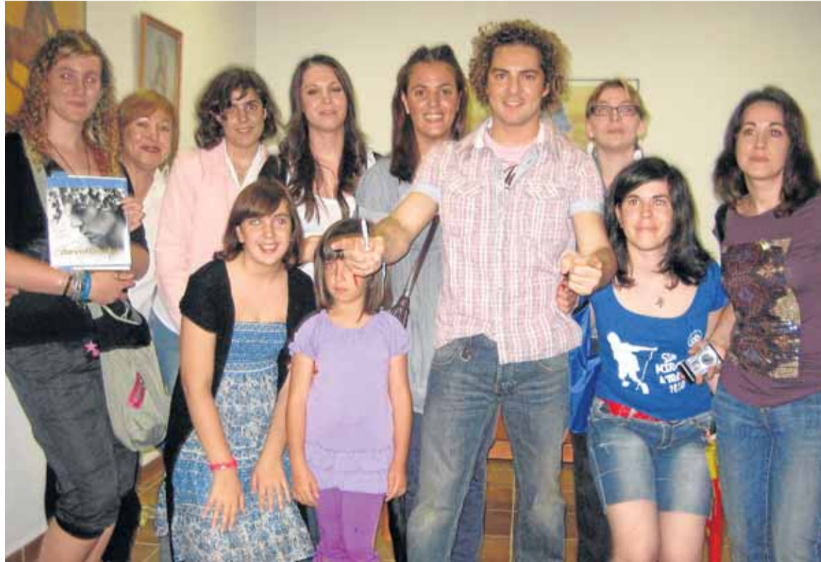
■ David, con todas las agraciadas en el sorteo que se realizó entre los socios del Club de LA VOZ.