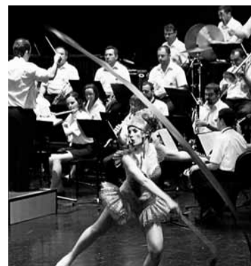
■ La banda municipal.

El programa será de una variada temática así como de una complejidad importante. El concierto empezará con una pieza titulada Almería que ha sido escrita por un compositor italiano llamado Vincenzo Nápoli. Se trata de una marcha característica que ha sido de-