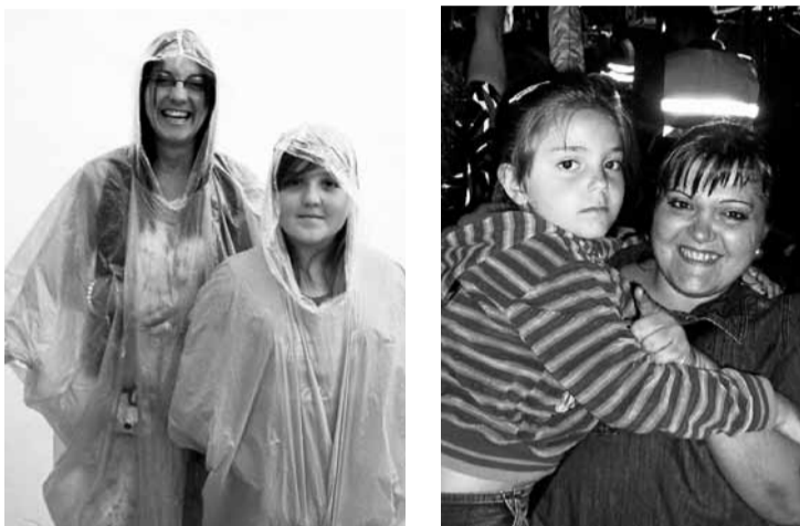
■ Todo caras sonrientes, madres, hijas y hermanas. / JAI