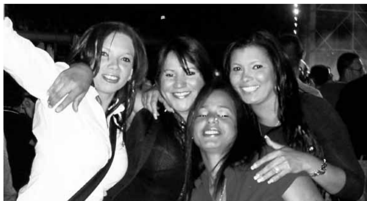
■ Cuatro amigas brasileñas en pleno concierto.