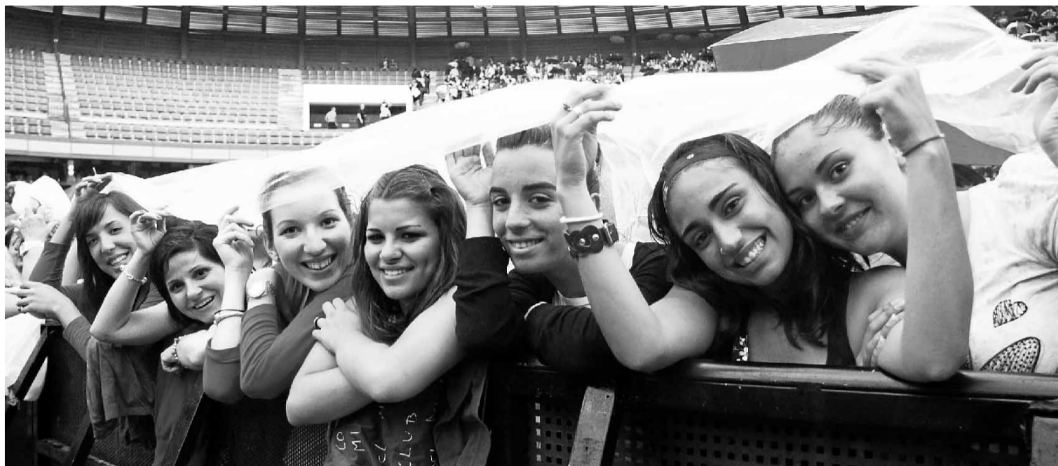
■ Las chicas que llegaron las primeras tuvieron que resguardarse de la lluvia horas antes del concierto.

Daouda debió saltar a la cuarta canción cuando comenzó a sonar su canción preferida, "me paso medio tiempo fuera de casa pero también representando a Almería", afirmó Bisbal antes de que la guitarra atacara la canción de Daouda. El con-