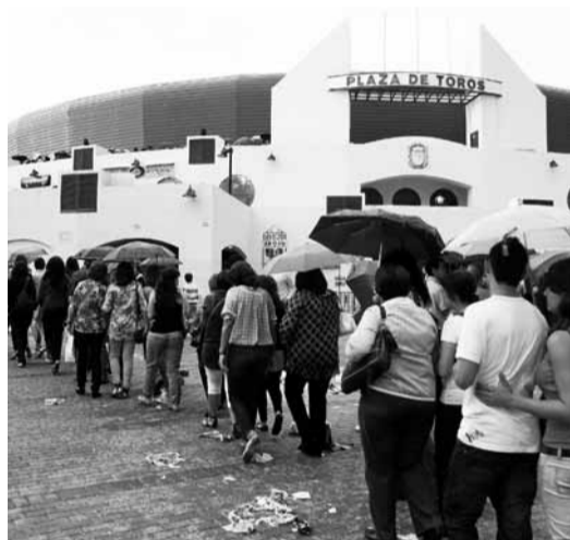
■ Aspecto de la cola de entrada.

El club de fans oficial animó la espera en los tendidos siete y ocho