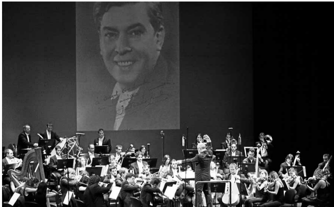
■ Un momento del concierto de anoche.

El Auditorio Municipal no registró ni media entrada para oír un concierto con la música del compositor almeriense